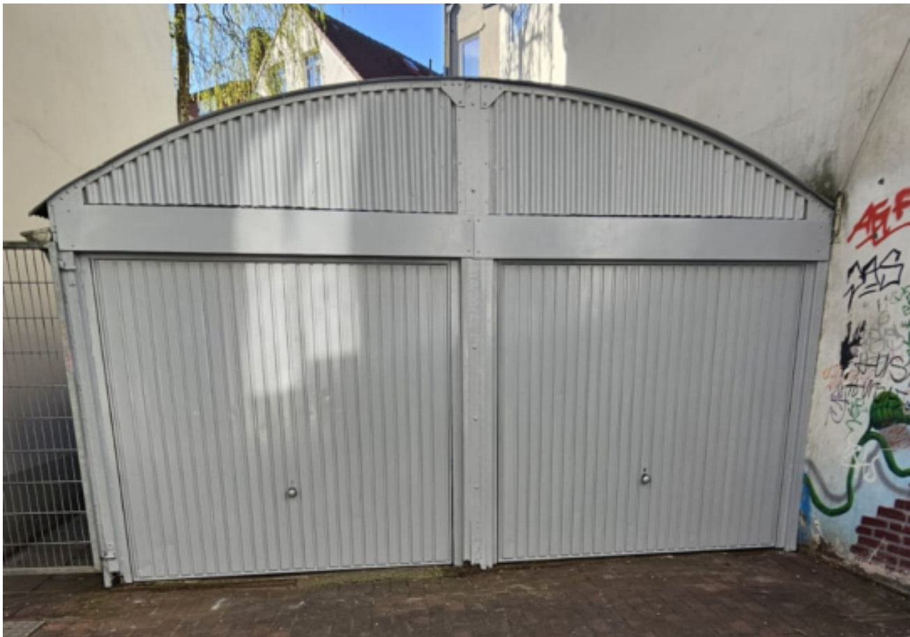
Bildunterschriften: Ein erfolgreiches Beispiel aus dem Jahr 2025 von „einWANDfrei“: Garagen an der Baumgartenstraße.